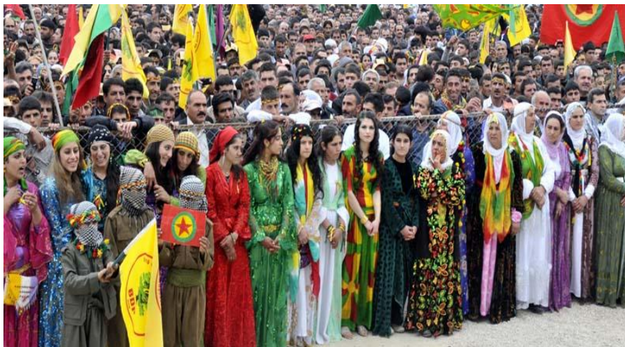
جاودان باد نوروز ما